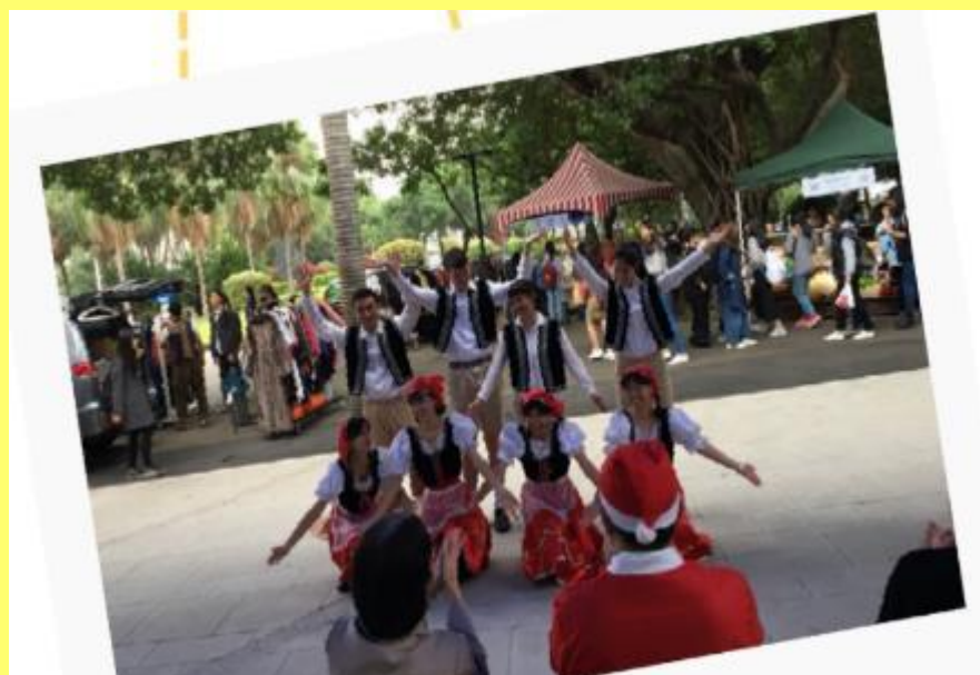
《2017德芳外語大樓落成啟用開幕表演》