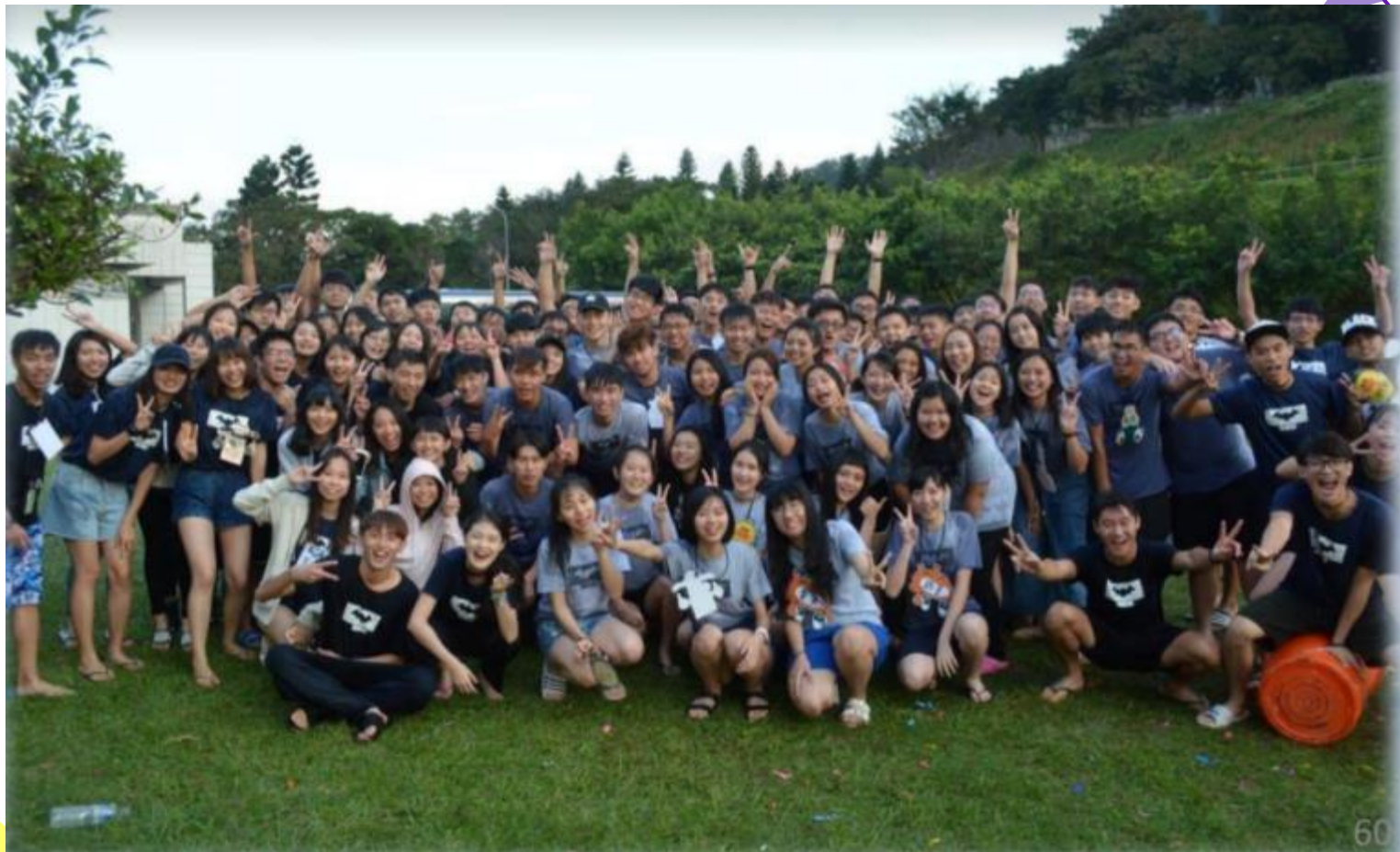
《2017德語 X 物理光電聯合迎新宿營-石門山勞工育樂中心》