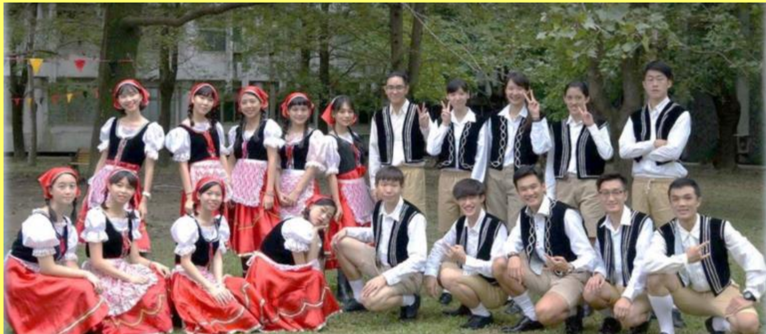
《2017德國文化節擊鞋蘭德勒表演》

在輔大的第一場公開表演，架式十足，雖然不是空前但一定絕後 <OS：表演完後，情人坡就沒有情人也沒坡了...>