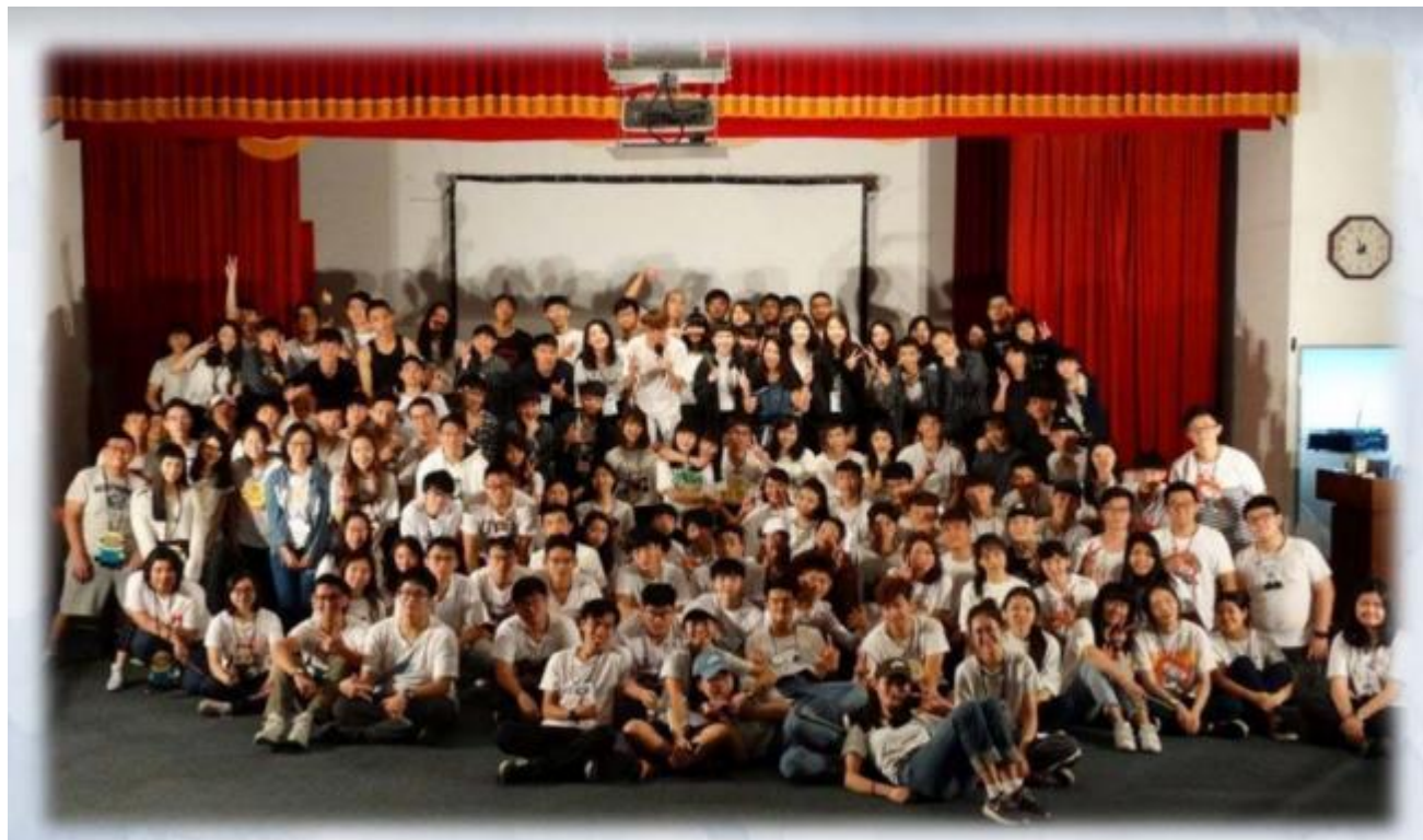
《2017德語 X 物理光電聯合迎新宿營-石門山勞工育樂中心》